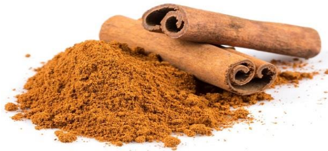
Gambar 7. Kayu Manis

Berdasarkan data dari Tabel 9 dan Gambar 7 dapat dilihat bahwa rata-rata tekanan darah meningkat setelah pemberian kulit kayu Manis adalah 144/87 mmHg dengan standar deviasi 5.164/4.830 mmHg. tekanan darah Untuk pasien hipertensi, nilai terendah 140/80 mmHg dan nilai tertinggi 150/90 mmHg di Wilayah kerja Puskesmas Kumun Kota Sungai tahun 2018. Yang berarti ada perubahan sesudah pemberian kulit kayu manis kepada kelompok perlakuan, jadi bisa disimpulkan hasil Studi ini memperlihatkan bahwa kayu manis memiliki efek memindahkan tekanan darah Sistolik dan Diastolik pada Pasien Hipertensi.