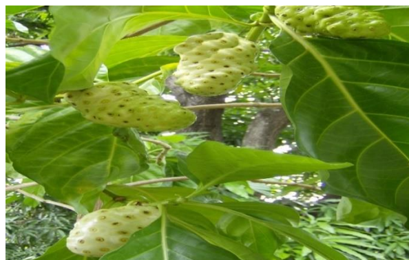
Gambar 9. Mengkudu

Berdasarkan data dari Tabel 11 dan Gambar 9 dapat dilihat bahwa penelitian yang dilakukan oleh Rona Febriyona dan Inne Ariani Gobel (2021), menemukan bahwa rata-rata tekanan darah sistolik pada awal pengangkatan adalah 169,00 mmHg, tekanan darah sistolik terendah adalah 150, dan tekanan darah sistolik tertinggi adalah 220 mmHg. Pada akhir janji rata-rata tekanan darah sistolik 154,50 mmHg, tekanan darah sistolik terendah 140, dan tekanan darah sistolik tertinggi 200 mmHg. Hasil ini menunjukkan bahwa mengkudu merupakan obat nonfarmakologi/tradisional yang cocok untuk menurunkan tekanan darah pada lansia.