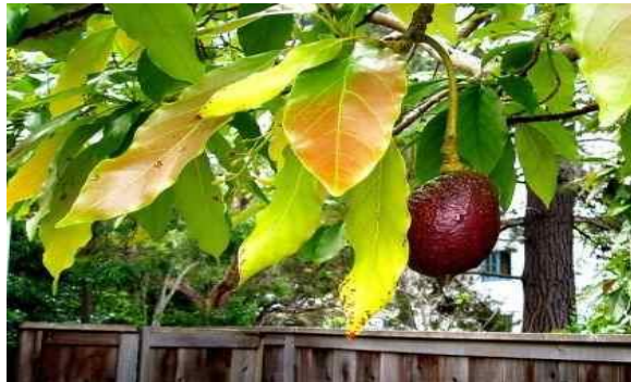
Gambar 11. Daun Alpukat

Berdasarkan data dari Tabel 13 dan Gambar 11 dapat dilihat bahwa berdasarkan penelitian Juli Andri dan Ramadhan Trybahari Sugiharno (2023), diketahui dengan p-value untuk tekanan darah sistolik 0,000 dan p-value untuk tekanan darah diastolik 0,000, dapat disimpulkan bahwa intervensi menggunakan rebusan daun alpukat sebelum dan sesudah pengobatan secara signifikan mengurangi tekanan darah.