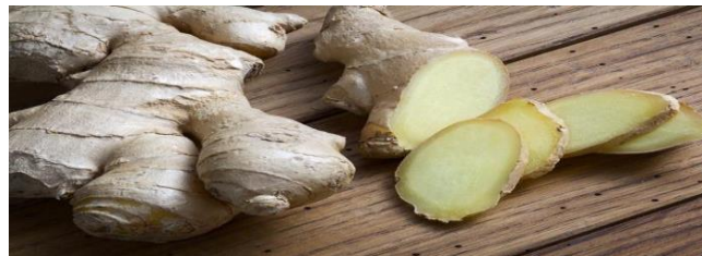
Gambar 15. Jahe

Berdasarkan data dari Tabel 18 dan Gambar 15 dapat dilihat menurut penelitian yang dilakukan oleh (Kristiani, R. B., & Ningrum, S. S., 2021) didapatkan hasil setelah dilakukannya intervensi air jahe terdapat perbedaan tekanan darah yang ditunjukkan dari tes Mann Whitney U menunjukkan perbedaan tekanan darah 0.001 < 0.05 Mann Whitney U memiliki p-value 0.001 ( <0.5 ) dari data diatas dapat disimpulkan jika mengkonsumsi air jahe berpengaruh terhadap penurunan tekanan darah lansia yang menderita hipertensi.