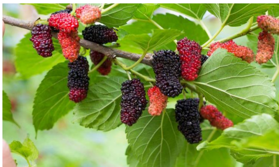
Gambar 4. Murbei

Berdasarkan data dari Tabel 4 dan Gambar 4 dapat dilihat bahwa terdapat perbedaan tekanan darah sistol pada kelompok perlakuan yang diberikan sekitar 240 ml selama 3 hari setiap pagi apabila rebusan daun murbei sebelum dibelah memiliki rata-rata 160,45 mmHg, dengan standar deviasi 13,61. Sebelum menerima rebusan daun murbei, tekanan darah diastol kelompok perlakuan rata-rata adalah 96,36 mmHg dengan standar deviasi 6,57. Tekanan darah rata-rata kelompok perlakuan sebelum dan sesudah diberi rebusan daun murbei masing-masing adalah 160,45/96,36 mmHg dan 140,45/90,00 mmHg, menurut temuan analisis data uji independen, dimana p\text{-value} = 0,000 dengan \alpha = 0,05 maka ( p < 0,05 ). Temuan ini menunjukkan perbedaan substansial antara tekanan darah orang dengan hipertensi dan rebusan daun murbei.