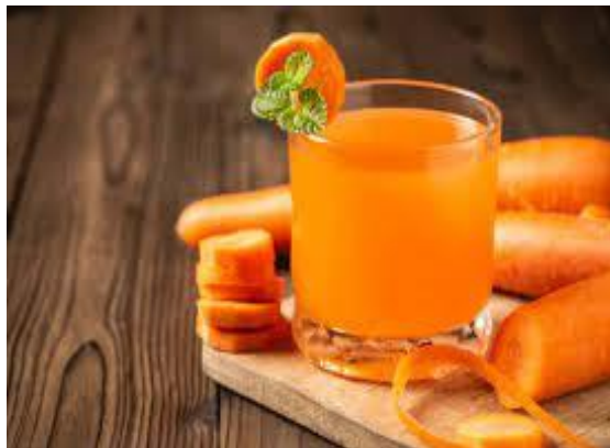
Gambar 3. Jus Wortel

Berdasarkan data dari Tabel 3 dan Gambar 3 dapat dilihat bahwa menurut Laila, W., Nurhamidah, N. dan Santika, L. (2019), stres seringkali sebelum mengonsumsi jus wortel, tekanan darah sistolik pasien hipertensi adalah 161,56 mmHg. Tekanan darah sistolik rata-rata setelah mengonsumsi jus wortel adalah 136,00 dengan standar deviasi 4,706 mmHg, sedangkan rata-rata adalah 6,762 mmHg. Hasil uji statistik dengan p-value 0,000 Hal ini menunjukkan bahwa di antara individu hipertensi, ada beberapa hubungan antara tekanan darah sistolik sebelum dan sesudah pengobatan. Dapatkan jus wortel. Pasien dengan hipertensi yang sebelumnya mengonsumsi jus wortel memiliki tekanan darah diastolik rata-rata 91,88 dengan standar deviasi 9,106. Meskipun memiliki tekanan darah biasa, setelah mengonsumsi jus wortel, tekanan darah diastolik yaitu 83,75 dengan standar deviasi 13,723. Hasil tes menunjukkan perbedaan yang signifikan secara statistik 0,000, menunjukkan bahwa tekanan diastolik hipertensi