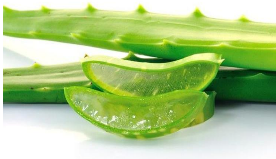
Gambar 5. Lidah Buaya

Berdasarkan data dari Tabel 6 dan Gambar 5 dapat dilihat bahwa terlihat saat memakai lidah buaya Distribusi nilai rata-rata tekanan darah sistolik responden ialah 125,50 mmHg (st dev = 6,66886). Nilai minimumnya adalah 120,00 mmHg dan nilai maksimumnya adalah 140,00 mmHg. dengan rata-rata diastolik Respon 76,50 mmHg (st dev = 4,61690), minimal 70,00 mmHg dan 80,00 mmHg maks. Berdasarkan hasil penelitian diatas, maska dapat disimpulkan mengonsumsi lidah buaya efektif dalam penurunan tekanan darah.