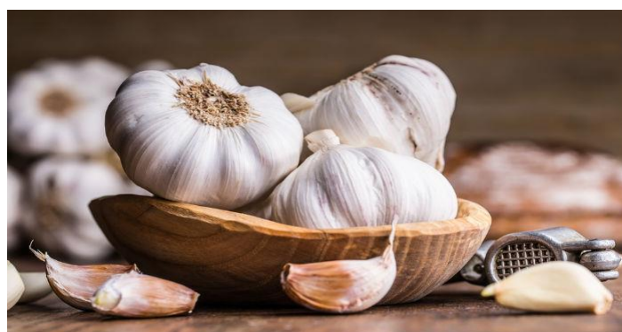
Gambar 8. Bawang Putih

Berdasarkan data dari Tabel 10 dan Gambar 8 dapat dilihat bahwa berdasarkan hasil penelitian Zuhana, Dedi Pahrul, dan Efta Sepriyanti (2022), Tekanan darah sistolik diukur sebelum dan sesudah seduhan air bawang putih, dan hasilnya menunjukkan bahwa yang pertama rata-rata 126,93 dan yang terakhir 125,43. Nilai diastolik rata-rata sebelum pengobatan masing-masing adalah 112,53 dan 88,90. Interval kepercayaan untuk nilai sistolik sebelum 125,87-12,88, nilai diastolik sebelum 107,81-117,26, nilai diastolik setelah 2,161, dan nilai diastolik setelah 124,63-126,24. Pada tahun 2021, boleh dikatakan bahwa air bawang putih di Puskesmas Pegayut menurunkan tekanan darah.