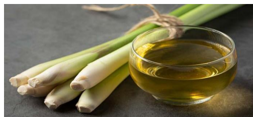
Gambar 14. Serai & Teh Serai

Berdasarkan data dari Tabel 17 dan Gambar 14 dapat dilihat menurut penelitian yang dilakukan oleh (Pangestuti, R & Sutik., 2022) hasil analisis dua sampel menunjukkan selisih tekanan darah diastolik ( PV=0,001 < \alpha=0,05 ) dan tekanan darah sistolik ( PV=0,000 <