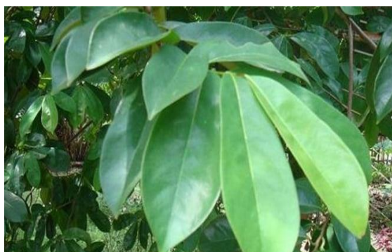
Gambar 10. Daun Sirsak

Berdasarkan data dari Tabel 12 dan Gambar 10 dapat dilihat bahwa menurut Juli Andri et al. (2022), tekanan darah sistolik berkurang sebesar 6,54 mmHg dan tekanan darah diastolik menurun sebesar 4,14 mmHg ketika rebusan daun sirsak dikonsumsi. Dengan nilai p sistolik 0,008 dan nilai p diastolik 0,038, analisis statistik menunjukkan perbedaan yang signifikan antara sebelum dan sesudah intervensi. Dalam hal ini terjadi penurunan tekanan darah sistolik dan diastolik sebelum dan bila diperlukan dengan cara merebus daun sirsak bagi penderita hipertensi di wilayah kerja Puskesmas Lingkar Barat Bengkulu.