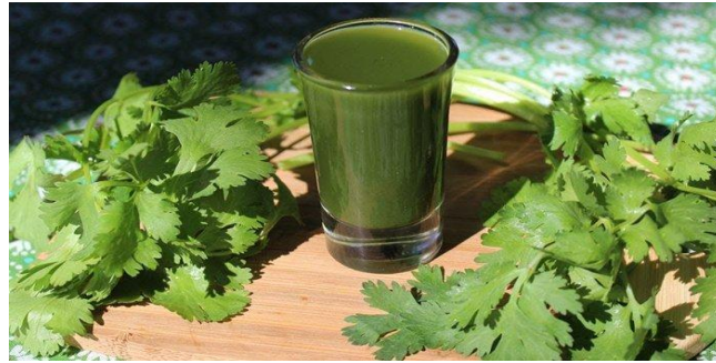
Gambar 13. Seledri dan Jus Seledri

Berdasarkan data dari Tabel 16 dan Gambar 13 dapat dilihat bahwa menurut penelitian yang dilakukan oleh (Simamora, L., dkk. 2021) ditemukan bahwa sebelum jus seledri diberikan rata-rata tekanan darah sistolik adalah 171 mmHg dan tekanan darah diastolik adalah 101 mmHg, tetapi setelah intervensi rata-rata tekanan darah sistolik adalah 141 mmHg dan tekanan darah diastolic adalah 87 mmHg. setelah mengkonsumsi jus seledri adanya perbedaan pasca intervensi adalah tekanan darah lebih rendah, 30 mm Hg untuk sistolik dan 14 mm Hg untuk diastolik. Oleh karena itu, dapat disimpulkan bahwa jus seledri efektif untuk menurunkan tekanan darah tinggi.