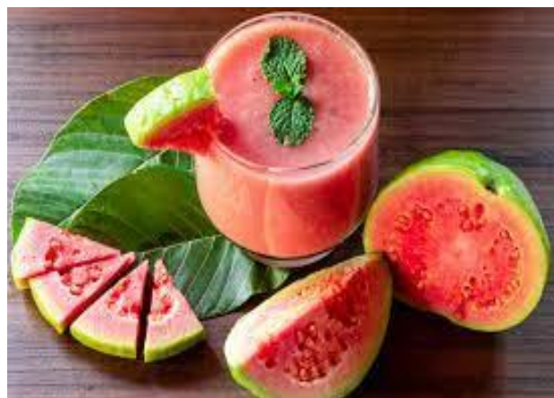
Gambar 1. Jambu Biji

Berdasarkan data dari Tabel 1 dan Gambar 1 dapat dilihat bahwa penelitian Susito, S., Susanti, N., & Sari, D. E. (2019) dari Hasil Uji Statistik nilai p dengan uji t berpasangan dengan signifikansi 95% Sistolik = 0,002 ( p < 0,005 ). dan nilai p diastolik = 0,001 ( p < 0,005 ), maka H_a diterima yang artinya pengaruh pemberian jus jambu biji merah terhadap tekanan darah lansia hipertensi di panti jompo Sinar Abadi Singkawang tahun 2017 ditunjukkan dengan nilai p nilai. Sistolik = 0,002 dan diastolik = 0,001