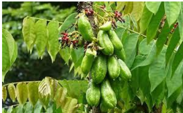
Gambar 12. Belimbing Wuluh

Berdasarkan data dari Tabel 15 dan Gambar 12 dapat dilihat bahwa menurut penelitian yang dilakukan oleh (Putri, M., Sudarmi, S., & Kuswanto, K. 2022) ditemukan hasil tekanan darah sistol pre-intervensi teh belimbing wuluh adalah 163,13 mmHg dan terjadi perubahan setelah diberikannya intervensi menjadi 134,06 mmHg. Begitupun, dengan tekanan darah diastole yang turun menjadi 75,00 mmHg setelah diberikannya intervensi. Maka dapat disimpulkan olahan daun belimbing yang dibuat menjadi teh adalah efektif dan dapat menjadi alternatif untuk obat anti-hipertensi.