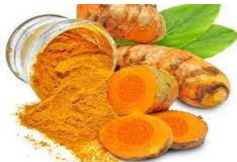
Gambar 2. Kunyit

Berdasarkan data dari Tabel 2 dan Gambar 2 dapat dilihat bahwa berdasarkan penelitian Anisha, R.N., Priwahyuni, Y. dan Erianti, S. (2019). Terlihat Rerata tekanan darah sistolik sebelum intervensi ekstrak kunyit adalah 133,00 mmHg Tekanan diastolik rata-rata adalah 1.539. dan tekanan darah sistolik maksimum adalah 138 mmHg, sedangkan tekanan diastolik tertinggi adalah 88 mmHg. tekanan darah Tekanan darah sistolik terendah 125 mmHg dan tekanan darah diastolik terendah 82 mmHg. menunjukkan rata-rata tekanan darah sistolik setelah pemberian dosis ekstrak kunyit sekitar 131,88 mmHg, sedangkan rata-rata hipertensi diastolik sekitar 83,53 mmHg. Akibatnya, standar deviasi hipertensi sistolik adalah 3,551, dan tekanan darah diastolik adalah 1,328. Tekanan darah sistolik tertinggi 137 mmHg dan tekanan darah diastolik tertinggi 85 mmHg. Tekanan darah sistolik terendah adalah 125 dan tekanan darah diastolik terendah adalah 80 mmHg. Berdasarkan hasil penelitian tersebut, dapat disimpulkan bahwa ekstrak kunyit efektif Menurunkan tekanan darah pada pasien prehipertensi.